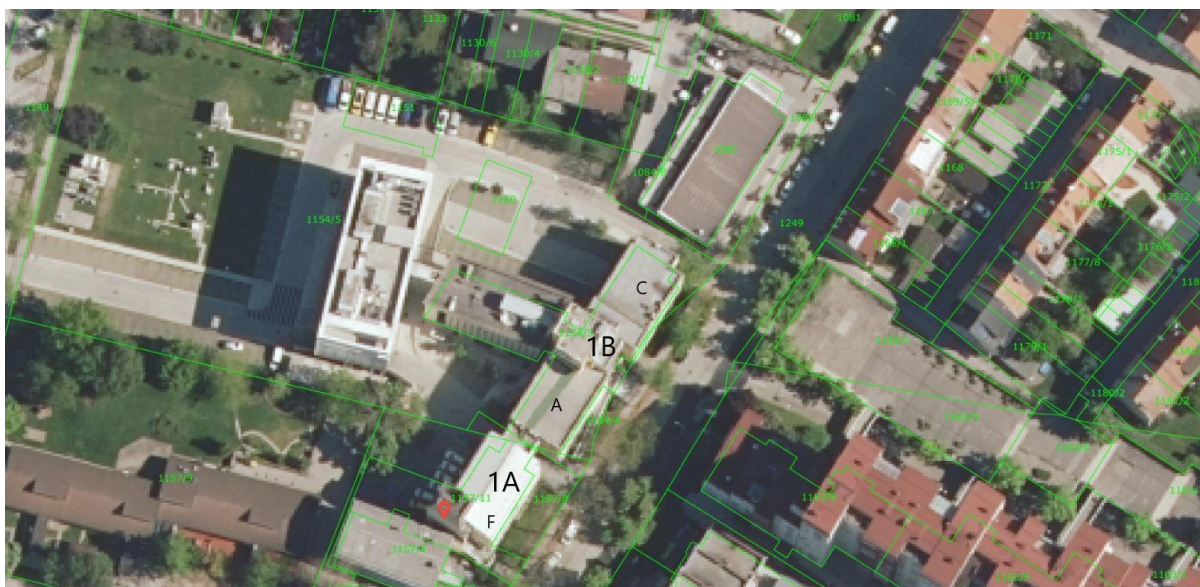
Shematski prikaz sestave predmetnih objektov – slika

Objekt 1B – trakt B je bil zgrajen leta 1991. BTP objekta 2 meri cca. 1260,45 m 2 .